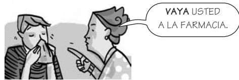
VAYA (verbo ir)