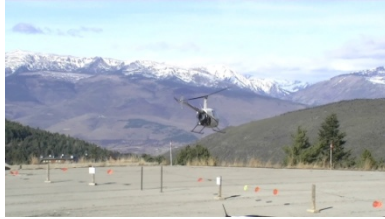
2. Es _____