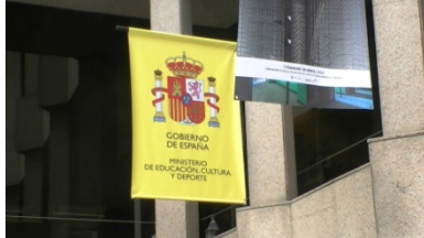
5. Son _____