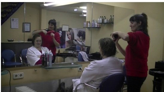
4. Es _____