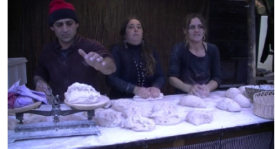
6. Son _____