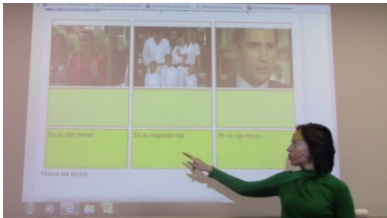
7. Es _____