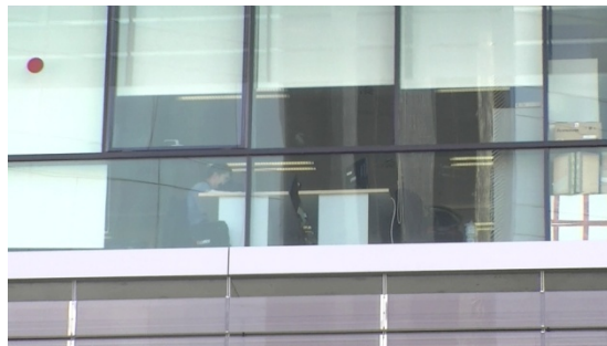
3. Es _____