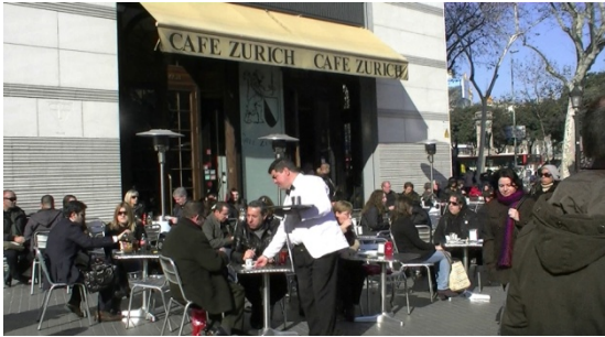
1. Es _____

administrativo ● dependiente ● médico peluquera ● camarero ● cocinero