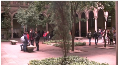
4. Son _____