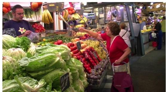
5. Es _____