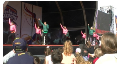
9. Son _____