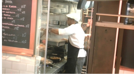
2. Es _____