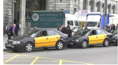
3. Son _____