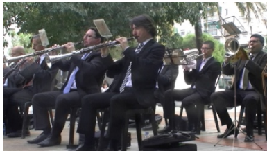
8. Son _____