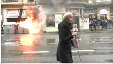
1. Es _____

taxistas • panaderos • cantantes funcionarios • periodista • músicos piloto • estudiantes • profesora