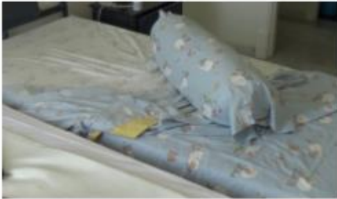
1. Tiene que hacer su cama.

8 ¿Qué tiene que hacer la chica? Escucha el vídeo y escribe una frase en cada foto.