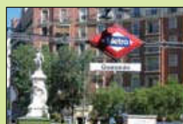
Estación de metro