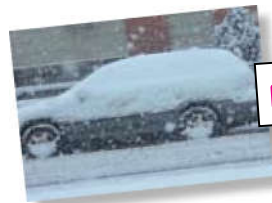
Hace mal tiempo