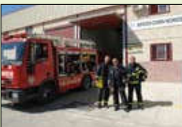
Bomberos (Parque de bomberos)