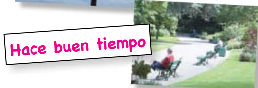
Hace buen tiempo