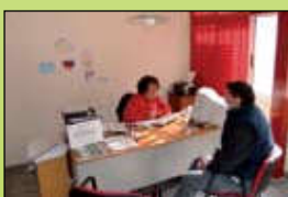
Oficina de información