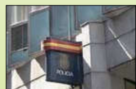
Comisaria de policia