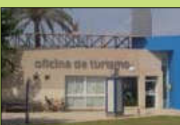
Oficina de turismo