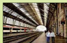
Estación de tren