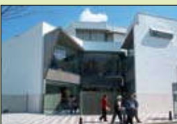
Centro de salud