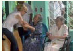
Residencia de ancianos