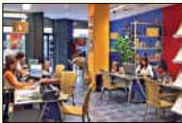
Agencia de viajes

EDIFICIOS, ESTABLECIMIENTOS, QUE SE PUEDEN ENCONTRAR EN UNA CIUDAD