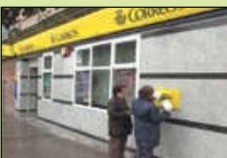
Correos y telégrafos